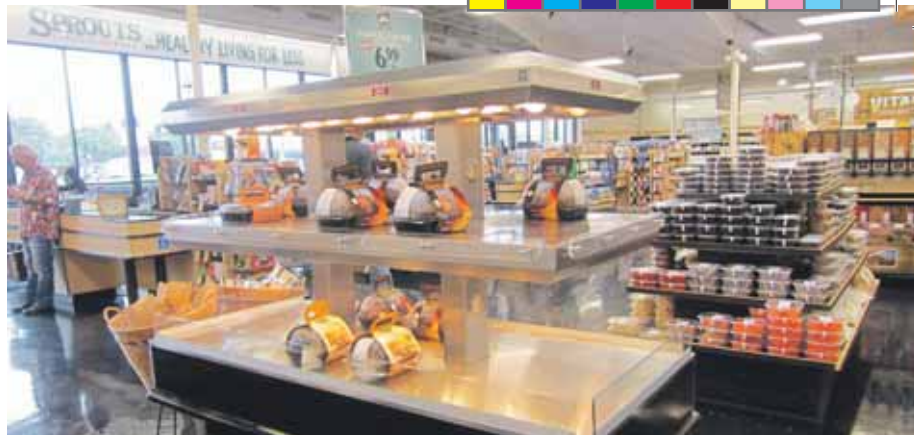
Gegrilde kip. Staat warm klaar bij de kassa. Hemmes: "Voor nog geen € 5,50. Ik heb deze foto rond half zeven 's avonds genomen. Dus kennelijk wordt het goed verkocht."