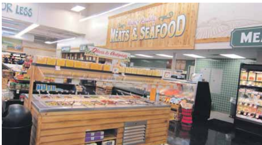
Sprouts gebruikt veel gebrand grenenhout bij de versafdelingen. Hier bijvoorbeeld zien we dat goed, met de olijven- en tapasmeubel (oké, er staat 'antipasto', maar dat is ongeveer hetzelfde, alleen dan Italiaans) schuin voor de bedieningsafdeling voor vlees en vis. Opmerkelijk trouwens: vlees en vis vormen één afdeling.