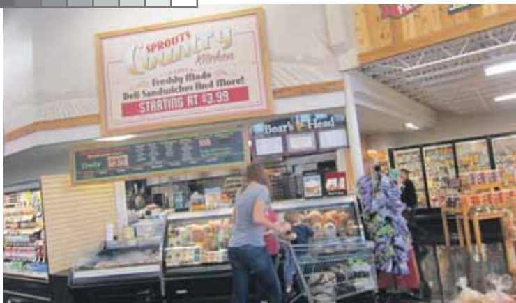
De 'keuken' van Sprouts, maar dat is vooral de versmodule voor sandwiches. Hemmes: "Met de uitnodiging om je eigen sandwich samen te stellen. De ingrediënten als kaas, vleeswaren, tomaat etc. liggen vooraan in de vitrine."