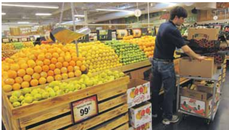
Niet alleen bij Whole Foods Market worden de appels en peren netjes gestapeld gepresenteerd. Hemmes: "Geen voorverpakte hoeveelheden. Daardoor lijkt het in deze 'farmer's market' ook zo van de 'farm' te komen. En de klant bepaalt zo zelf hoeveel hij/zij wil hebben. Maar goed, in onze supermarkt is ook veel fruit niet voorverpakt."