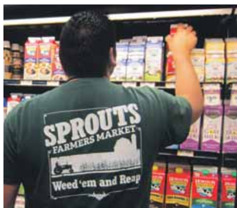
De oude tractor en landbewerking komen zelfs terug op de kleding van de medewerkers.

waaronder ook het deel van het vroegere Henry's Marketplace-vestigingen, aan Smart & Final, een zelfbedieningsgroothandel voor consumenten en detailhandelaars, zoals Costco en Sam's Club (van Walmart). Maar, hupsakee: Smart & Final wordt in datzelfde jaar onderdeel van Apollo, een van de grootste investeringsmaatschappijen van de VS. De Boney-familieleden die dan nog met Sprouts in de weer zijn, gaan in 2011 ook met Apollo en diens investering Smart & Final in zee. Apollo/Smart & Final krijgt een meerderheidsbelang in Sprouts, in ruil voor meer uitbreidingskansen. En waar bestaan die uit? Sprouts krijgt de verzameling van 43 Henry's Marketplace-vestigingen erbij. Die zijn dan nog steeds niet tot Smart & Final omgebouwd. En deze verschuiving is ook een opmerkelijke terugkeer van Henry's tot de familie Boney zelf, die al weer een formule verder waren, met Sprouts immers. Smart & Final en Apollo doen nog meer. Smart & Final stopt met een net daarvoor gestarte operatie in Colorado, een zb-groothandelsformule met meer vers. Of die heeft het dan slecht gedaan, of Smart & Final doet dat als onderdeel van deze deal, dat blijft onduidelijk. Smart & Final en Apollo doen meer: er is ook nog Sun Harvest Markets, ook in