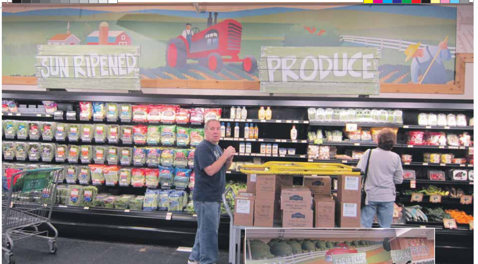
Het interieur van Sprouts Farmers Market: overal beelden van een oude tractor, een land, landbewerker. En bij de afgeef een pick-up uit de jaren dertig.