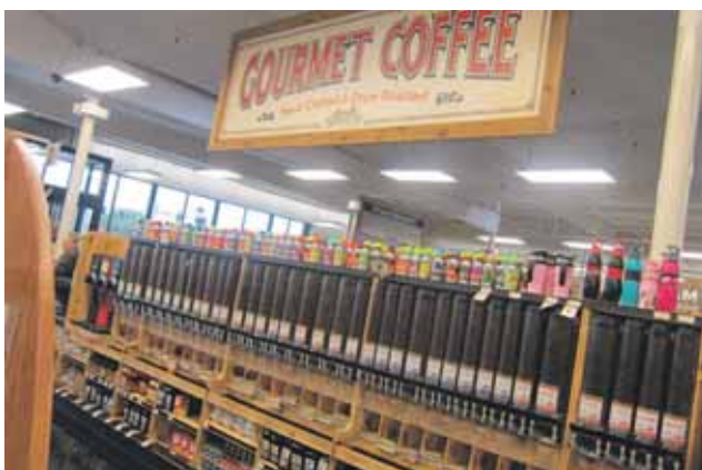
En nog een tap: koffiebonen. Ook wel eens gezien in een Nederlandse supermarkt. Maar niet zo: Amerikanen slagen erin om 36 verschillende smaken/brandingen te presenteren. Hemmes: "Die Amerikanen creëren zo een sterkere koffiecultuur dan wij, terwijl wij oorspronkelijk een sterkere koffiecultuur hebben."

Nee, Sprouts is bepaald niet de 'farmer's market' zoals wij ons dat voorstellen. ■