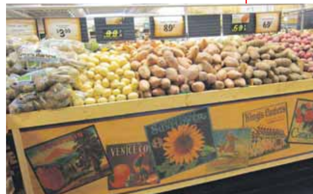
Bijzondere oude reclame-affiches tegen de wand van de agf. Ook dat zien we bij verschillende ketens in Oklahoma en Texas vaker. Kennelijk hebben zij het gevoel dat ze de consument iets 'goeie ouwe tijds' moeten laten zien en is er een soort golf van nostalgie. Dat zal dan zeker voor de 'farmers' markets' gelden. Hemmes: "Oklahoma is in 1889 'opengesteld' voor 'settlers', de eerste pioniers. Historie hebben ze nauwelijks, maar wellicht juist omdat de geschiedenis zo jong is, hechten ze er veel belang aan."

Utah, New Mexico, Colorado, Oklahoma en Texas. Sprouts is weer de zoveelste formule die aan het bekende Whole Foods Market doet denken. Eerder al konden we dat zeggen van Uptown en Central Market in deze reeks. Formules met een nadruk op biologisch en 'health & wellness', vaak producten van kleinere leveranciers (ook in dkw) en als het kan een regionaal aanbod. Whole Foods Market is in de VS allang geen formule meer waar anderen niets van overnemen.