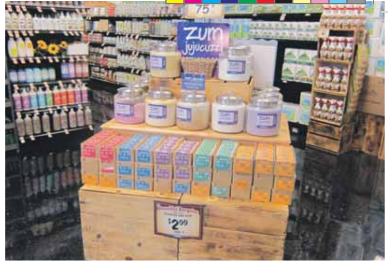
Sommige cosmetica oogt als afkomstig uit de wat alternatieve hoek, zoals dit badzout van het merk Zum Jujucuzzi. Hemmes: "Per ounce te koop, zelf uitscheppen."