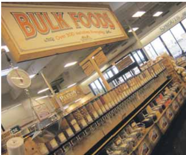
Een tap... Er hangt een bord boven met 'bulk foods' in grote letters. Maar Sprouts heeft het dan niet over wat wij onder bulk verstaan (bier, fris, wc-papier, suiker etc.), maar een tap met ontbijtgranen.

Zelf honing tappen. Ooit gezien in een Nederlandse supermarkt? Wij niet. Hemmes: "Je kunt de honing in een bakje laten lopen, maar ook in een plastic beker. Leuk voor de kinderen. Zo krijg je die wellicht ook weer aan de honing."