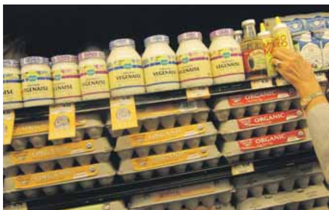
Hier een voor ons opvallende mayonaise, gemaakt met olie die uit druivenpitten is geperst. In de VS worden druivenpitten vaker gebruikt voor olie. Druivenpitten worden goede eigenschappen toegedicht; veel vitamine E, antioxidanten, mineralen en meervoudig onverzadigde vetzuren.