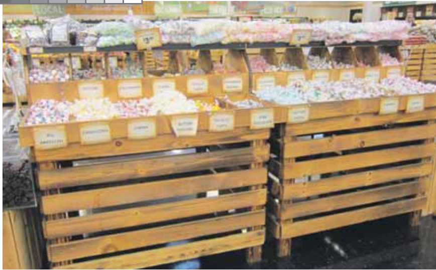
Ook hier, bij deze zelfschepmodule van snoep, valt het houtwerk van de presentatie meteen op. Hemmes: "Je kunt als klant voor zelf scheppen kiezen, maar je kunt ook een voorverpakte hoeveelheid nemen. Die liggen boven op de display."